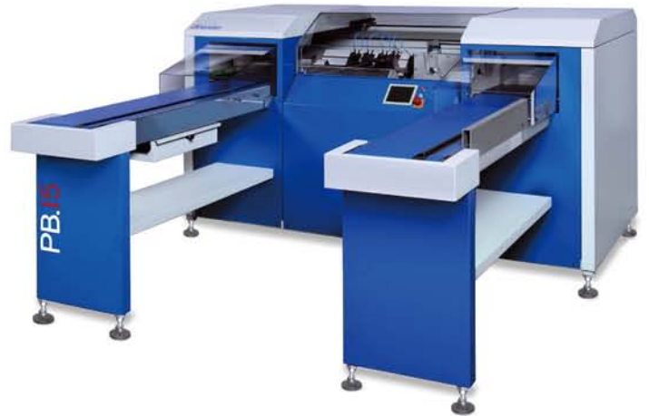
Dürselen PB 15 型多头钻孔机