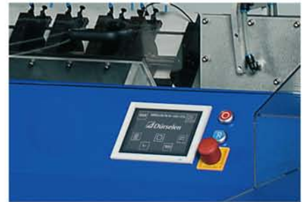
通过编程触摸屏控制系统，可轻松实现纸张幅面转换、钻孔模式转换等操作