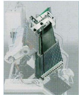
PB15：气垫台配合低摩擦镀铬传送辊，即使是薄软脆弱材料也可被平顺传输